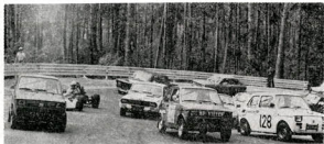
A2 WIELKI WYŚCIG