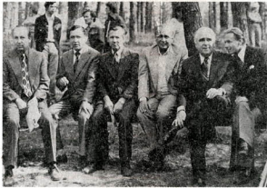
A3 WIELKI WYŚCIG