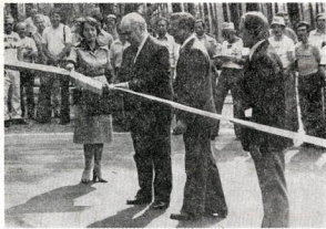
A1 WIELKI WYŚCIG