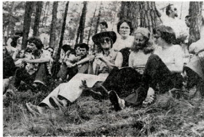
A4 WIELKI WYŚCIG